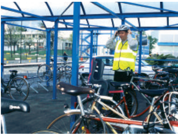
Parking à vélos de l'Entreprise STMicroelectronics.

Le plan d'actions de transport, réalisé en interne ou par des consultants spécialisés, consiste à mettre en place un ensemble de mesures variées.