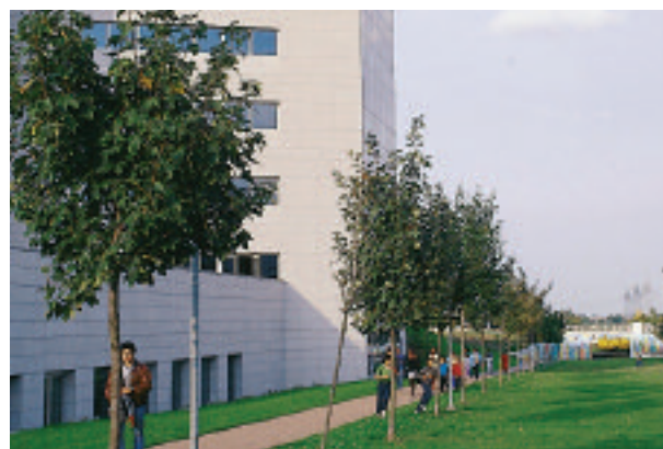
Réalisation de chemins piétonniers facilitant l'accès aux immeubles.

11,4 millions de déplacements journaliers sont effectués dans un cadre professionnel en Ile-de-France.